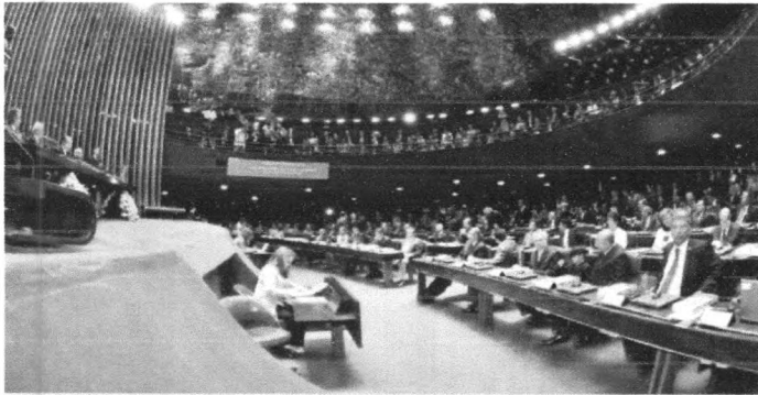
Projeto que cria o Sistema Nacional de Educação está no Senado para ser deliberado